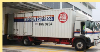
(マレーシア・ハラール専用車両)