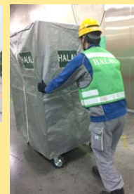
(ハラール専用台車)