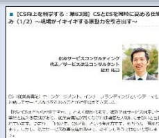
連載コラム「サービスを科学する」