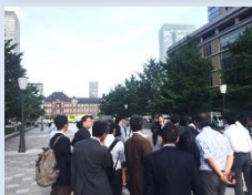
三菱地所 東京・丸の内エリアの視察