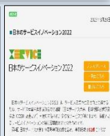
ベストプラクティス事例紹介