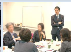
SPRING Café 「CSを語る」 ※法人会員限定