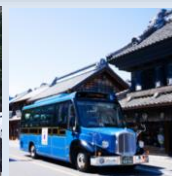
イグルバス SPRINGフォーラム オンライン開催