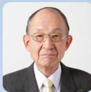
代表幹事 茂木 友三郎 (公財)日本生産性本部 会長 キッコーマン(株)