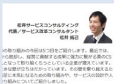
連載コラム「サービスを科学する」