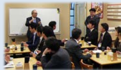
「てんやの成長戦略と人創り」 (用松社長講演・見学付)