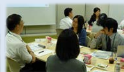
SPRING Café 「CSを語ろう」

● 情報提供 サービス産業の最新情報が満載！ イベントや各種発表等のお知らせも随時届きます