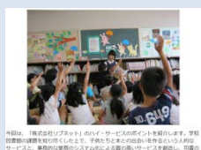
ベストプラクティス事例紹介

● 経営「なんでも」相談窓口（初回無料） 経営戦略・人材育成等について専門家がアドバイス！