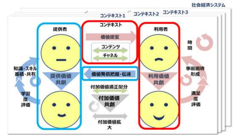
【価値共創のサービスモデル (ニコニコ図)】

本研修では、企業が単独で価値を創り出すのではなく、顧客と共に価値を創り出す「 価値共創 」の仕組みを実装するための フレームワーク を学ぶことで、 事業の見直しや改善・改革、新規事業発案、営業施策を練るための実践的なヒント を得ることができます。