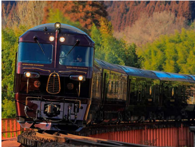
【第1回日本サービス大賞 内閣総理大臣賞 九州旅客鉄道（株）】 【第4回日本サービス大賞 内閣総理大臣賞（株）エアークローゼット】