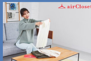
第4回日本サービス大賞 内閣総理大臣賞 (株) エアークローゼット