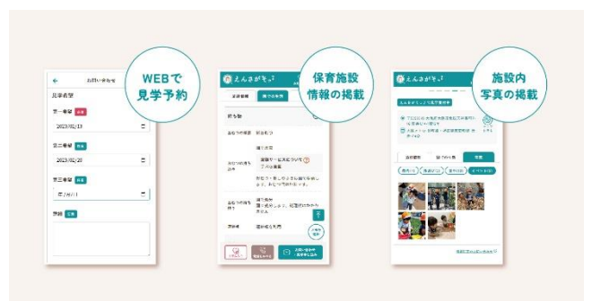
▲2022年6月にリリースした「 えんさがそっ♪ 」園探しから見学申し込みまで「保活」をサポートする