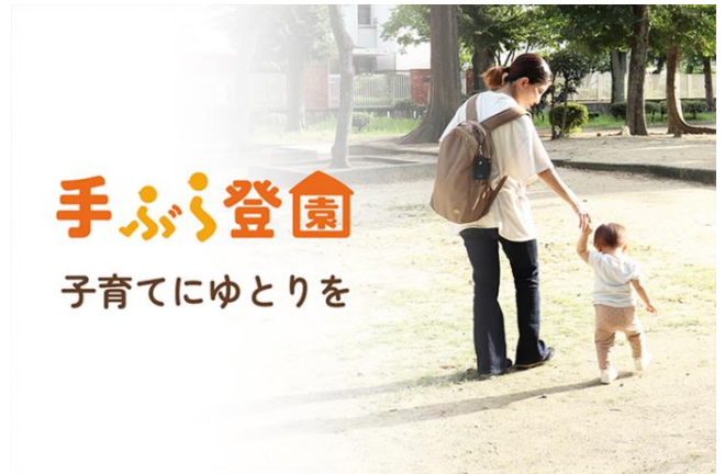
▲サービスイメージ