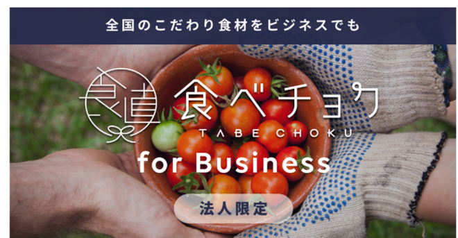
▲食べチョクのこだわりの食材を顧客へのギフトなどビジネスでもご利用いただける法人向けサービス「食べチョク for Business」