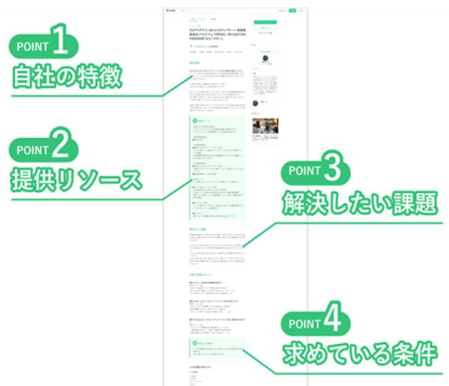
▲共創プロフィールの作成ページでは、オープンイノベーション実践に必要な4点を記入