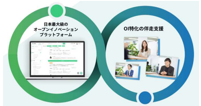
▲日本最大級のオープンイノベーションプラットフォームであり、オープンイノベーションに特化した伴走型支援が特徴