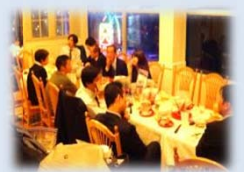
キッザニアのビジネスモデル 講演・見学会後の懇親会

● 情報提供 サービス産業の最新情報が満載！ イベントや各種発表等のお知らせも随時届きます