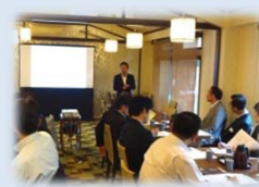
がんこ屋敷 新宿山野愛子邸