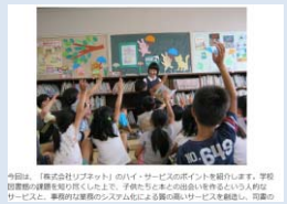
ベストプラクティス事例紹介

● 経営「なんでも」相談窓口（初回無料） 経営戦略・人材育成等について専門家がアドバイス！