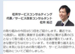
連載コラム「サービスを科学する」