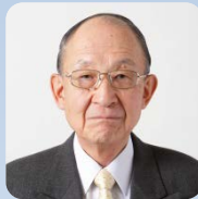
代表幹事 茂木 友三郎 (公財)日本生産性本部 会長 キッコーマン(株)